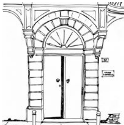
ATTO di CARITA'

< La Carità tutto scusa, tutto spera, tutto sopporta > (1Corinzi 13,7)