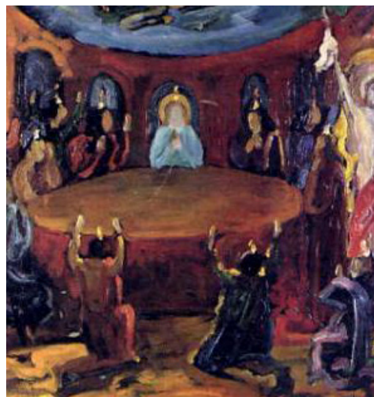
La Pentecoste B. Tozzi 1960

Verità: Dio Padre. Libertà: Cristo Gesù. Amore: Spirito Santo.